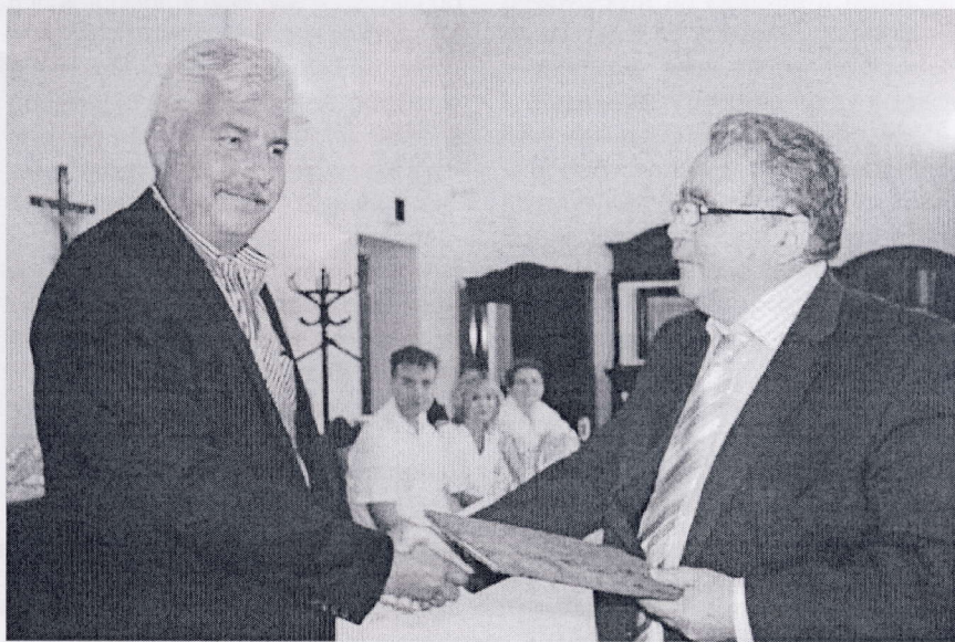
Odvzdávanie darovacej zmluvy.

Toto moderné zariadenie dnes ešte stále nie je úplne štandardnou súčasťou vybavenia všetkých nemocníc na Slovensku – aj vzhľadom na jeho finančnú nedostupnosť. V Univerzitetnej nemocnici s poliklinikou Milosrdných bratov v Bra-